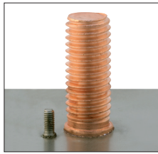
Semi-automatic and fully automatic feed of studs with flange as per DIN EN ISO 13918