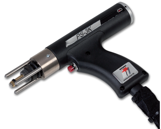
Bolzenschweißpistole PS-3K PS-3K stud welding gun

Example of use: Component with galvanized surface.