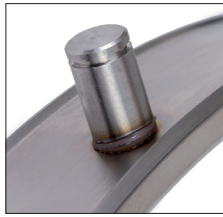
Kleiner, gleichmäßiger spritzerfreier Schweißwulst Small, regular and spatter-free weld collar