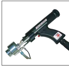
Schweißpistole PH-3N SRM zum Mutter- und Bolzenschweißen mit magnetisch bewegtem Lichtbogen PH-3N SRM welding gun for nut and stud welding using a magnetically moved arc