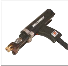
Standardschweißpistole PH-2 PH-2 standard welding gun